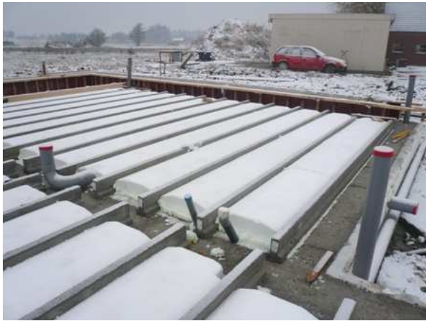
RC waarde 9,0 Systeemvloer 6,4