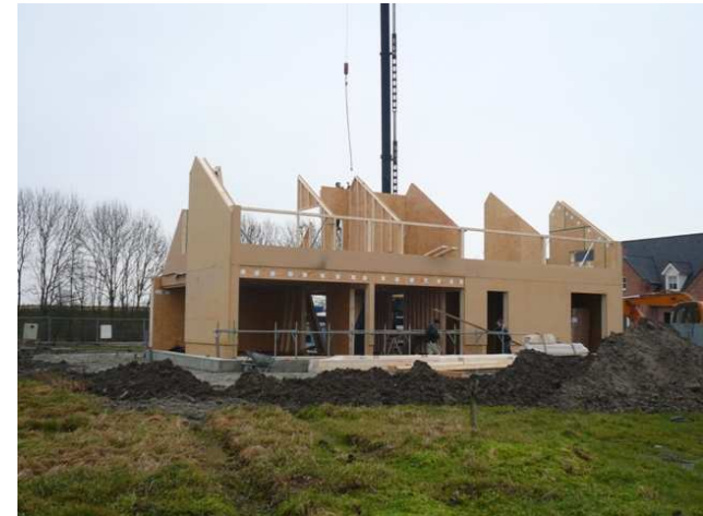
Houtskelet RC waarde 7,0