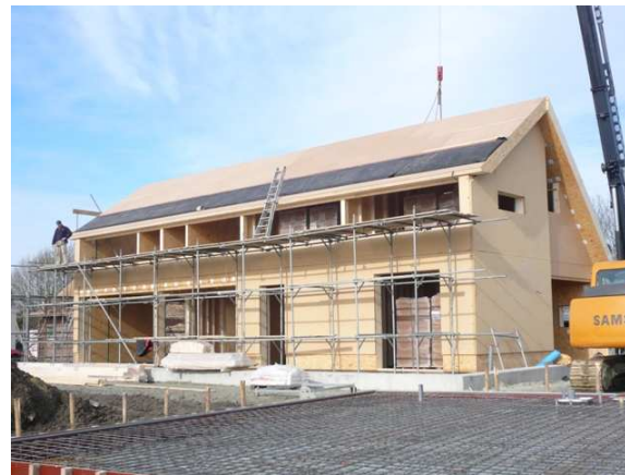
Dak RC waarde 6,8